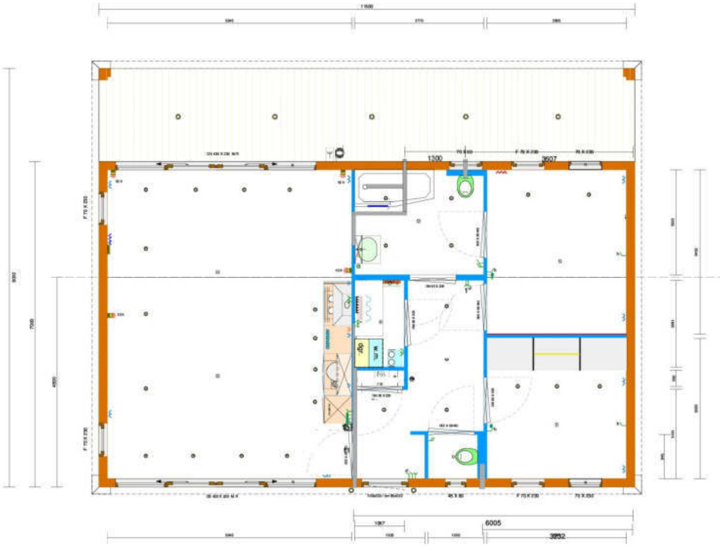
XL 120 Abmessung 8,00 x 15,00 m